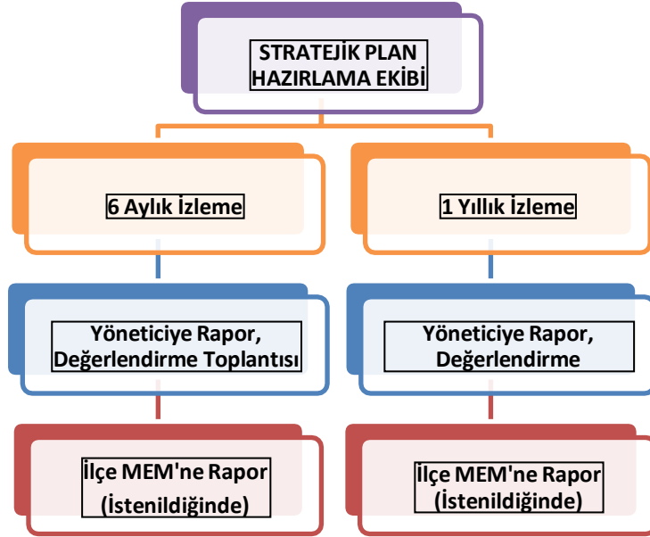
Şekil 1: İzleme ve Değerlendirme Süreci

Müdürlüğümüzün 2024-2028 Stratejik Planı İzleme ve Değerlendirme sürecini ifade eden İzleme ve Değerlendirme Modeli hazırlanmıştır. Okulumuzun Stratejik Plan İzleme- Değerlendirme çalışmaları eğitim-öğretim yılı çalışma takvimi de dikkate alınarak 6 aylık ve 1 yıllık sürelerde gerçekleştirilecektir. 6 aylık sürelerde Okul Müdürüne rapor hazırlanacak ve değerlendirme toplantısı düzenlenecektir. İzleme-değerlendirme raporu, istenildiğinde İlçe Milli Eğitim Müdürlüğüne gönderilecektir.